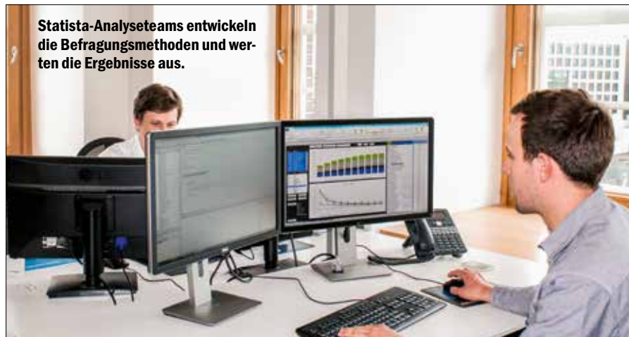
Statista-Analyseteams entwickeln die Befragungsmethoden und werten die Ergebnisse aus.

■ Fachliche Kompetenz: Wird man als Kunde bei Problemen mit Standardlösungen oder Floskeln verdröset? Oder sind Profis am Werk, die Probleme mit Sachkenntnis und praktischen Tipps lösen? Als wichtigstes Service-Merkmal wurde es in die folgenden Übersichtstabellen aufgenommen und floss zu 27 Prozent ins Einzelkriterien-Urteil mit ein.